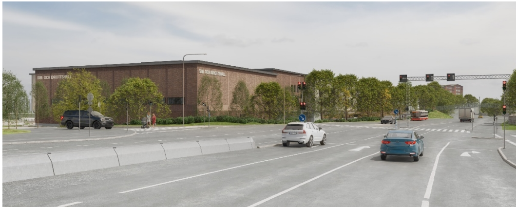
Perspektiv från Huddingevägen i korsningen Björkängsvägen/Huddingevägen. Bild: a och d arkitektkontor.

Stor vikt läggs vid utformning av publika platser runtomkring den nya hallbyggnaden för att skapa trivsamma och trygga ytor och platsbildningar. Fritidsgången, som går i östvästlig riktning genom gymnasieområdet söder om den nya hallbyggnaden, breddas och omvandlas till allmän plats mellan Gymnasietorget och Gymnasievägen. Stråket ansluter till befintlig gång- och cykelbana längs Gymnasievägen. Västerut finns gång- och cykelmöjligheter till Lännavägen via befintlig gång- och cykelbana samt Gymnasietorget.