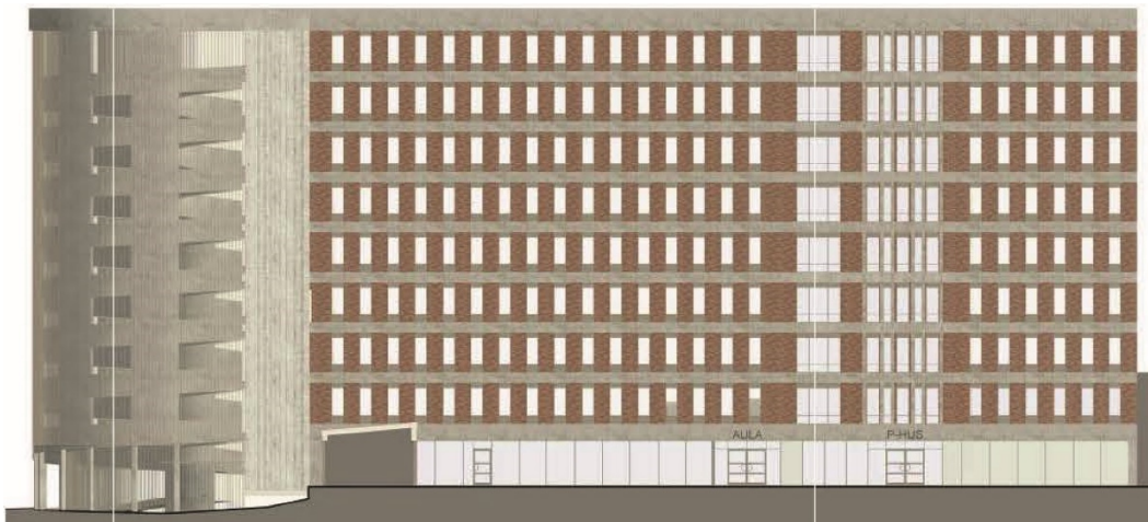
Fasadskiss över möjlig utformning av parkeringshuset mot Gymnasietorget. Bild: a och d arkitektkontor.

Utvecklingen av ytan väster om Huddingegymnasiet för parkering frigör attraktiv yta söder om hallen för annan användning och håller den fri från motortrafik. Området för utomhusidrott föreslås bli mer multifunktionellt. För att hantera regnmängder sänks delar av ytorna kring hallen och kombineras med spontanidrottsfunktioner. Ytan mellan Huddingegymnasiet och kullen utvecklas till park, och delar av parken används för nödvändiga nedsänkningar.