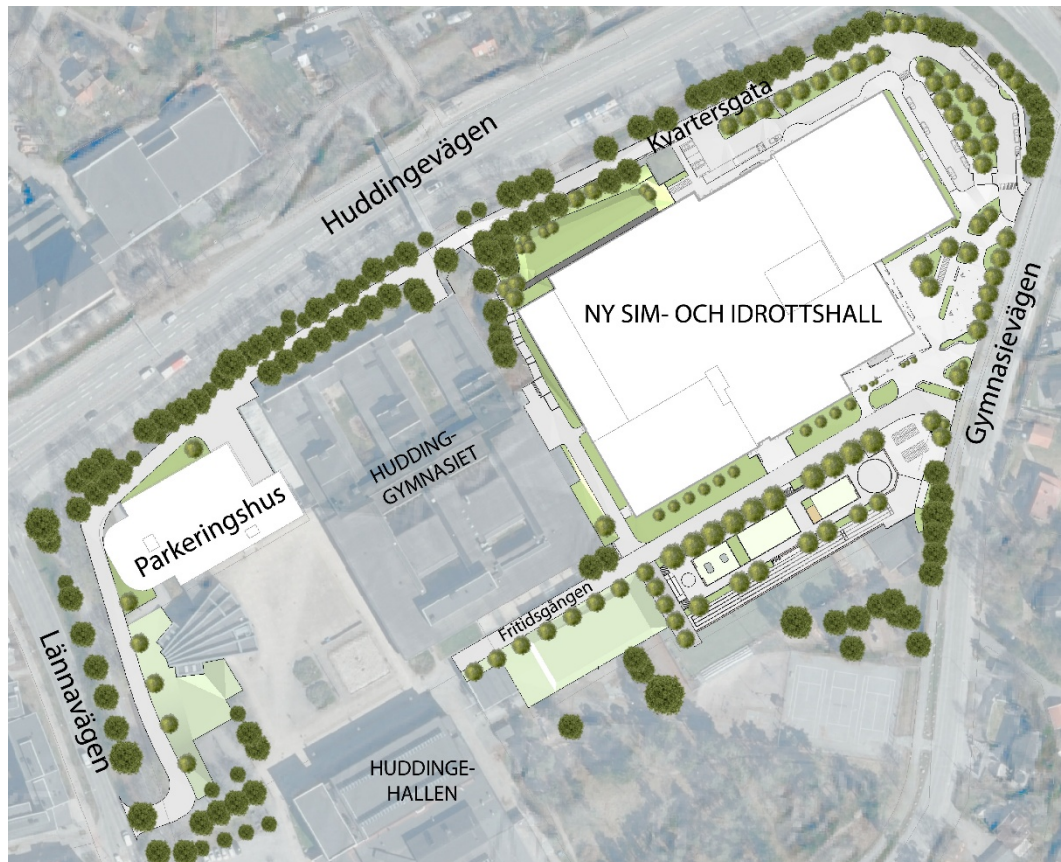
Illustrationsplan över möjlig utformning. Bild: Ek Landskapsarkitekter.

Den nya sim- och idrottshallen vid Huddingegymnasiet kommer att bli en viktig målpunkt och märkesbyggnad. Den kommer också att fungera som entré till centrala Huddinge, vilket gör att dess utformning anses vara mycket viktig. Byggnadens volym bryts upp visuellt i flera delar för att anpassas till omgivningen och bidra till att minska uppfattningen av den storskaliga volymen. Fasaden ska i huvudsak bestå av tegel och bottenvåningen av byggnadens huvudentréparti ska utföras huvudsakligen uppglasad för att ge ett välkomnande intryck. De viktigaste gestaltungsprinciperna regleras genom bestämmelser i plankartan. Ett gestaltungsprogram har upprättats som beskriver hallens och omgivande ytors gestaltning mer detaljerat. Denna biläggs exploateringsavtalet.